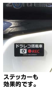
ステッカーも 効果的です。

あおり運転が社会問題となっている今、後方も撮影できるドライブレ コーダーの必要性はお客様の声からもよく伺います。